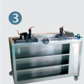
Z-25103: EPS-R Electric racks Cremaigliere elettriche (es. VW Golf V, Toyota, Nissan)