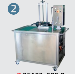
Z-25102: EPS-P Electric pumps Pompe elettriche