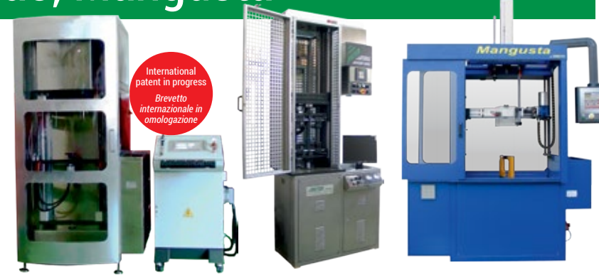
PRECISÃO MERAVILHOSA allows to test open shock absorbers consente la prova dell'ammortizzatore aperto PrecisaPlus Mangusta with new version in stainless steel con nuova versione in acciaio inox

Precisa, a tool that top garages all over the world have been using for more than 40 years, is a professional test bench made to check any kind of shock absorbers for cars, trucks, motorcycles, bicycles and even more. This machine may be supplied with electronic instrumentation and PC connection; the proprietary software developed for Microsoft Windows allows technicians to manage and save test history, and make advanced investigations on shock absorbers using the detailed graphs provided by the application. Mangusta is the ultimate instrument for machine shops, as it allows to open any kind of shock absorber in top-bottom position, automatically, and just in a few seconds, even without being specialized technicians. The machine is controlled by a proprietary software available in many different languages, and it is equipped with tools to open shocks manually or automatically, thread with screw-taps, weld manually or automatically, and a kit to pressurize monotube shocks (systems Bilstein-De Carbon).