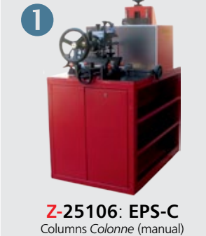
Z-25106: EPS-C Columns Colonne (manual)