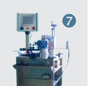
Z-25001: EPS-C Columns Colonne (automatic)