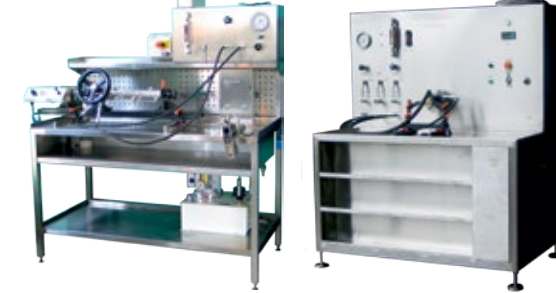
Power steering bench Banco prova idroguida Z-27000 Hydraulic pump bench Banco prova pompa idraulica Z-27002

Banchi prova idroguida e pompe Диагностический стенд для рулевых реек и насосов гидроусилителя Stoły testowe do przekładni i pomp Bancos de ensaio de direção hidráulica e bombas