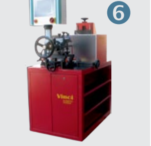
Z-25000: EPS-C Columns Colonne (manual)